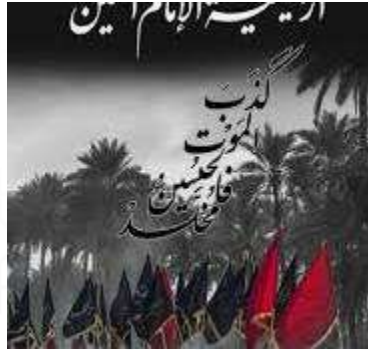
عينة رقم 3

الذهنية للحدث اذ ساهم الرمز في العملية التصميمية بتعميق الوعي وتكثيف المضمون وعمق الایحاء كما ان للملصق عناصر بنائیه سیادیه تتمثل باللون والشكل والخط والاتجاه والقيمة الضوئية والملمس والحجم كذلك علاقات جمالية في تحقيق التباين اللوني والخطي والملمسي والحجمي وتحقيق الایقاع الدوري لتكرار عبارات خلف الكف ذات قيمه ملمسيه سوداء غامقة تمثل مظاهر الحزن كقوى انفعاليه وجدانيه لا تخلو من قوه روحیه عقائدية باتجاه هدف الاصلاح والایمان بعدالة القضية الحسينية وتأكيد الولاء والتضامن والانتماء وقد تم تحقيق التوازن غير المتماثل على جانبي المحور العمودي للملصق وقد جاءت الدلالات التربوية باتجاه القوى العقلية الإدراكية لفكره ذهنيه غايه في التجريد والعمق والتوتر الدلالي في صياغه المعنى في تأكيد نمو وازدهار واستمراريه قيم الخير وصرخة الامام الحسين الإصلاحية من اليوم الاول لمحرم الحرام حتى الاربعين من صفر من كل عام - - هنا القيمة البيضاء رمز الطهارة والنقاء والورع والتقوى لركب الامام الحسين وال بيته الاطهار واصحابه الكرام بشكل عام ولصاحب لواء كربلاء ابو الفضل العباس قطيع الكفين بشكل خاص ويمثل اعلى قيمه التضحية والجود بالنفس في دعم الحسين في ملحمة كربلاء الخالدة والقيمة اللونية الحمراء للملصق حيث يراق الدم الطاهر النقي الطاهر رمز القيم النبيلة والمثل العليا لجوهر ومعدن الدين الاسلامي لصفوه الايمان يوم الطف كما لا يخلد تعبير التربوي والاجتماعي من بعد ايماني متمثل بصرخة الامام الحسين حيث تورق في اربعينه الامام شعارات العزة والاباء ومنها شعار هيهات منا الذله برفض الظلم والفساد وتأكيد منهج الاصلاح ومهما كلف من دماء طاهره